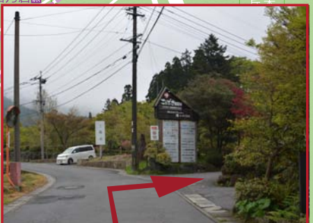
どちらからでも行けます