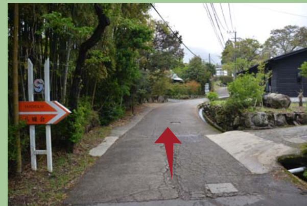
さらに真っすぐ進む。ここまでくると、もうすぐです