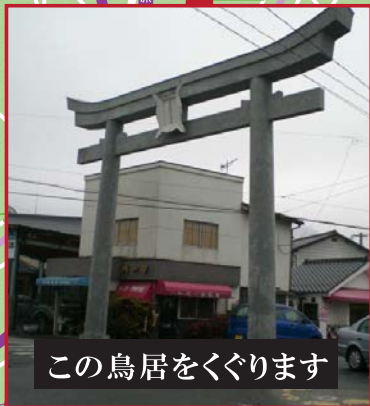
この鳥居をくぐります