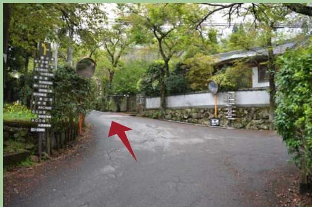
管理事務所の右の坂道を上がり分岐を左に