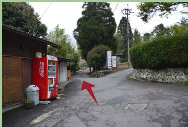
自動販売機を左に